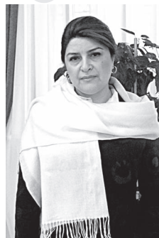
Міне тағы бір жылды артақтап Жаңа жыл парсылардың жаңа күні деп кеткен Наурыз мерекесі келіп жетті. Бүгінде Орта Азия халықтары жаппай мерекелейтін бұл мерекенің шығу тарихына үңілетін болсақ ең әуелі діни мереке ретінде парсы жерінде Ахменидтер билік құрған кезде тойлана бастаған. Кейін парсылардың қол астындағы барлық халықтар да тойлай бастайды. Наурыз мерекесі ең алғаш рет Абылқасым Фирдаусидің «Шахнама» поэмасында айтылған. Ол Наурыз мерекесін Джамиш патшаның таққа отыруы, оны ұлықтау сәтімен байланысты мерекелейтінін айтыпған. Осыдан барып парсы елінде таққа отыру рәсімі дәл осы Наурыз күні өткізуді әдетке айналдырған. Ал Омар Хаям өзінің «Наурызنامه» трактатында достықтың айы деп бірлік мерекесін тойлауды айтады. Ал Бұхарада өткізілетін наурыз жайында тәжіктің белді жазушылары Ахмед Дониш пен Саидриддин Айнидің еңбектерінен көруге болады екен. Ал қазір бұл мерекенің мағанасы әуелісінен кішкене өзгеріп жаңарып келген көктемді, жаңалық пен жаңаруды Жаңа жыл деп тойлауды қолға алды. 6000 жылдық тарихы бар наурыз Азербайжан, Қазақстан, Өзбекстан, Қырғызстан, Тәжікстан сынды елдерде мемлекеттік мереке саналады. Әрине бұл елдерде Кеңес Одағы тұсында мерекелеу мүмкін болмай тек жеке дербес мемлекет атанған соң көңнен тойлана бастаған. Тіпті Түркияда 1991 жылға дейін тойлау рұқсат етілмеген екен. Иранда наурыз 13 күн тойланады. Алғашқы бес күнін ағайын туыс арасында өткізу әдеті бар. Иран халқы дәл осы күні Адам ата жаратылып адам тағдырымен тікелей байланысты 12 түрлі жұлдызды жаратқан деп сенеді. Ал Тәжікстанда 21-23 наурыз күндері арасында спорттық жарыстар, әнмен әуеленген концерттер өтеді.