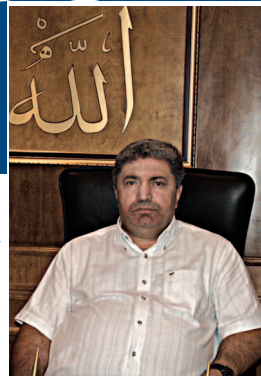
век, если трудится, не может остаться незамеченным.