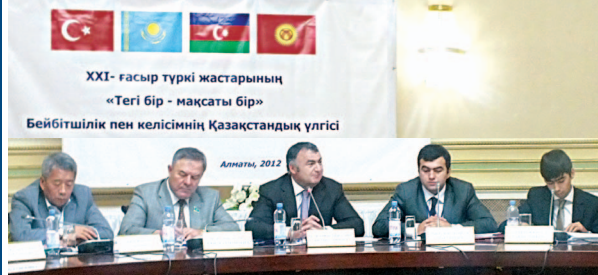
XXI-ғасыр түркі жастарының «Тегі бір - мақсаты бір» Бейбітшілік пен келісімнің Қазақстандық үлгісі Алматы, 2012

ЭЛЕКТРОННАЯ ВЕРСИЯ ГАЗЕТЫ: www.ahıska-gazeta.com