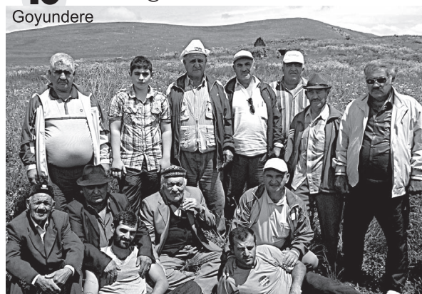
(Өввәли өтән сәјымызда)

Kadir Gecesi 26 / 27 Ağustos 2012 Salı'yı Çarşambaya Bağlayan Gece 19 AĞUSTOS PAZAR RAMAZAN BAYRAMININ 1. GÜNÜDÜR. Bayram Namazı 07:00