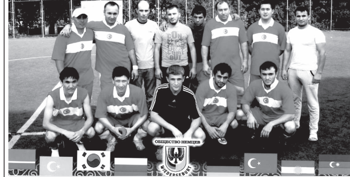
Турнир по футболу, посвященный Дню столицы среди этно-культурных объединений г. Астаны 4-5 июля 2012 г.