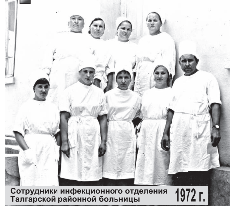
Сотрудники инфекционного отделения Талгарской районной больницы 1972 г.