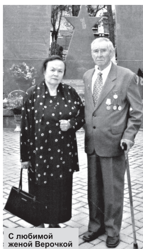
С любимой женой Верочкой