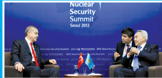
Nuclear Security Summit Seoul 2012

Қазақстан Республикасы Түрік этномәдени орталығының халықаралық басылымы