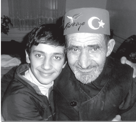
О дети, утешение моего сердца. Абай

С самого рождения жизнь ребенка складывается из двух различных влечений. Одно — это потребность есть, жить и спать, без чего тело ребенка не может стать приютом души, не будет расти и крепнуть. Второе — желание знать. Дитя стремится ко всему, что видит глаза и слышат уши. Подросток уже интересуется всем (Абай, Слово 22).