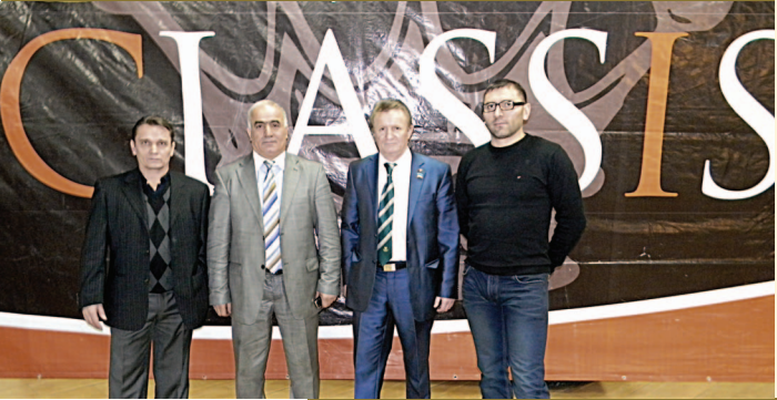
Сознание своих сил увеличивает их. Лук де Кляпье Воевнерэ