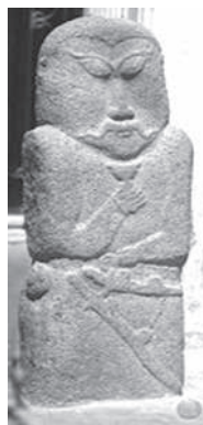
Каменное изваяние. Монголия. — Материал — камень. — Поклонение духу предков. — Расположение рук. — Сабля. — Усы.

Дополнительные сведения: — Наличие бокала. — Поклонение Жер-Су.