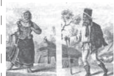
Дулебы (дулобы, дулаты) жители Восточной Европы. Реконструкция.

Сикеи — потомки Аттилы. На головном уборе сикея тамга дулатов.