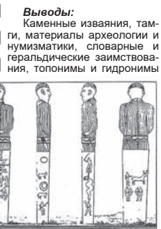
Тюрков в Европе открывают новые грани и страницы всемирной истории. И письменные источники тоже заговорили по-новому.

Выводы: Каменные изваяния, тамги, материалы археологии и нумизматики, словарные и геральдические заимствования, топонимы и гидронимы