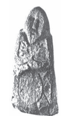
— Материал — камень. — Поклонение духу предков. — Тамга дулатов на уровне живота. — Расположение рук.

Скульптура во время нахождения во дворе музея «Пруссия» в Кёнигсберском замке 1927 г.