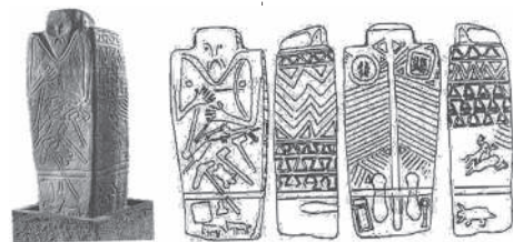
Керносковский идол. Днепровская область.

— Материал — камень. — Поклонение духу предков. — Расположение рук. — Четырехгранный столб. — Наличие усов. — Тамги уйсуней и её племени дулат на верхней части спины. — Тамга дулатов. — Тамга уйсуней. — Вторая тамга уйсуней. — Тамги уйсуней и ботбаев, рода племени дулат на уровне задней стороны ног. — Тамга уйсуней. — Тамга ботбаев. — Многожанровое скульптурное полотно.