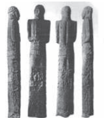
Этоский памятник. Найдены в с. Этюк, на берегу реки Этюк, правого притока Подюмки, Северный Кавказ.

Выводы: Новейшие материалы истории свидетельствуют, что тюрки в древние и средние века имели огромное влияние на необъятных просторах Евразии.