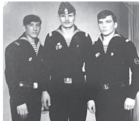
Ташкентского политехнического института и Ташкентского университета.