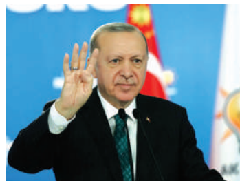
Президент принял участие в первом заседании Государственной комиссии по подготовке к празднованию 30-летия Независимости Республики Казахстан