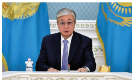
Токаев провел заседание Высшего совета по реформам Стр. 2

“Bu ülkede yaşayan istisnasız herkesin trafik güvenliği hususundaki çalışmalarına destek vermesi şarttır”