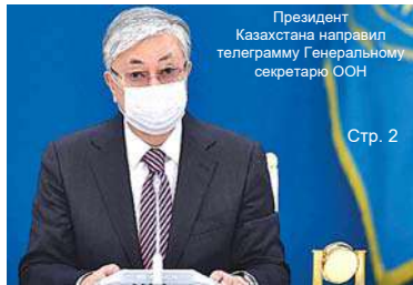
Президент Казахстана направил телеграмму Генеральному секретарю ООН