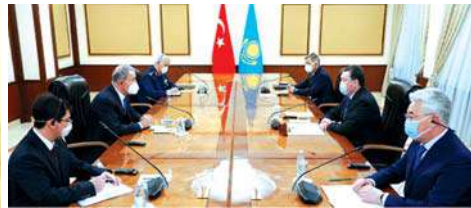
Казак askerleri Türkiye'de 'Siber Güvenlik' eğitimi alacak