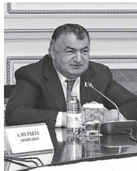
Уважаемые гости! Дорогие мои братья!

Очень рад видеть всех вас. К сожалению, пандемия внесла свои коррективы на все наши мероприятия. Сегодня наше мероприятие проходит в ограниченном составе, хотя планировали проведение 20-летнего юбилея газеты «Ахыска» в большом составе. Но мы благодарны Аллаху за то, что все мы пережили эту пандемию. Очень многие потеряли своих близких.