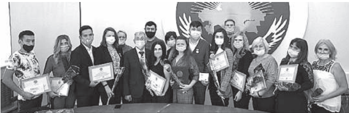
В Ассамблее народа Казахстана Северо-Казахстанской области состоялась церемония награждения волонтеров, которые активно вели свою деятельность в период карантина.

После введения карантина в стране на базе Ассамблеи народа Казахстана Северо-Казахстанской области был создан специальный волонтерский штаб, основная миссия которого заключалась в помощи гражданам, которые находились на самоизоляции. Как правило, это были пожилые люди и граждане с инвалидностью. Всего в штабе работали более 60 волонтеров. За время карантина на телефон штаба поступило больше 1500 заявок.