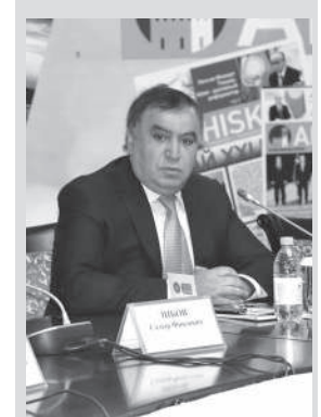
Уважаемые коллеги, друзья!

Мы никогда не делились на нации, нас в Казахстане так воспитали, что все мы интернационалисты. Просто мы знаем, что благодаря газетам, журналам, этнокультурным центрам народы Тюркского мира объединяются. Поэтому мы всегда стоим за то, чтобы, в первую очередь, в нашем Казахстане были мир, стабильность, общественно-политическое развитие, и мы хотим, чтобы такой же мир был во всех странах. Для этого мы прилагаем все свои усилия, проводим очень много бесед на эту тему в раз-