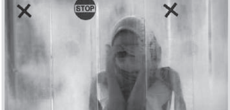
Ghebreyesus, ayrıca Doğu Avrupa ve Orta Asya'da da Covid-19 vaka sayılarının artışta olduğuna işaret etti.

Afrika kıtasındaki ülkelerin çoğunda vaka sayılarının artmaya devam ettiğini ifade eden Ghebreyesus, bununla beraber bu kıtadaki ülkelerin çoğunda vaka sayılarının binin altında olduğunu söyledi.