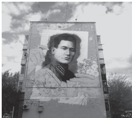
Мурал, посвященный Бауыржану Момышулы, появится в столице

Мурал, посвященный Бауыржану Момышулы — Герою Отечества, народному герою и гениальному полководцу появится в г. Нур-Султан по адресу ул. Ташенова, 10.