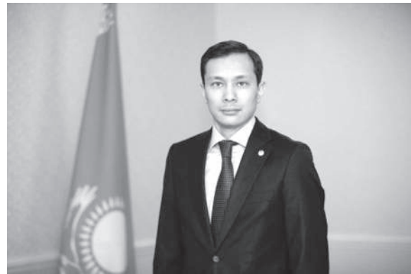
студенттері жүз пайыз қамтылады, бұл шамамен — екі жүз жиырма бес мың адам.

Сонымен қатар, Абай шығармалары бойынша сынып сағаттары, танымдық лекциялар, олимпиадалар, диктанттар өткізіледі. Бұл шаралардың жеңімпаздарына Жидебай-Берлі, Ақшоқы тарихи кешендеріне, Абай, Әуезов, Достоевский музейлеріне жасалатын түрлі экспедициялар мен туристік сапарларға жолдамалар беріледі. Мұндай іс-шаралармен мектеп оқушылары мен колледж