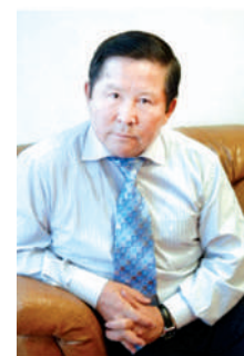
Алибек АСКАП, писатель, Заслуженный деятель Казахстана, Лауреат Государственной премии РК

Казахстан — золотая колыбель для 125 наций и народностей. Массовая депортация в Казахстан особенно интенсивно проходила в 1920—1940 годы. Сюда насильственно изгонялись неугодные советской власти народы.