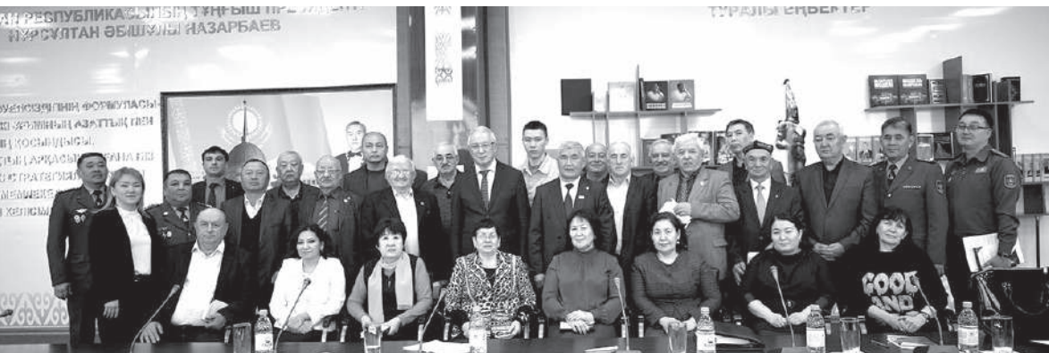
Подготовила Аида МАРПАТ

Между тем член Научно-экспертной группы АНК