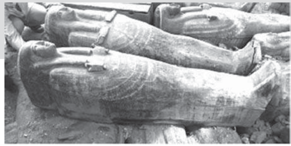
diğer malmelerin bulunduğu bir oda da gün yüzüne çıkarıldı.

Renkleriyle de dikkat çeken mezar- dala yelkenli gemilerin tasvirleri, tarlada açılan Mısırlılar ve tanınlanması zor olan karmaşık desenler yer alıyor.