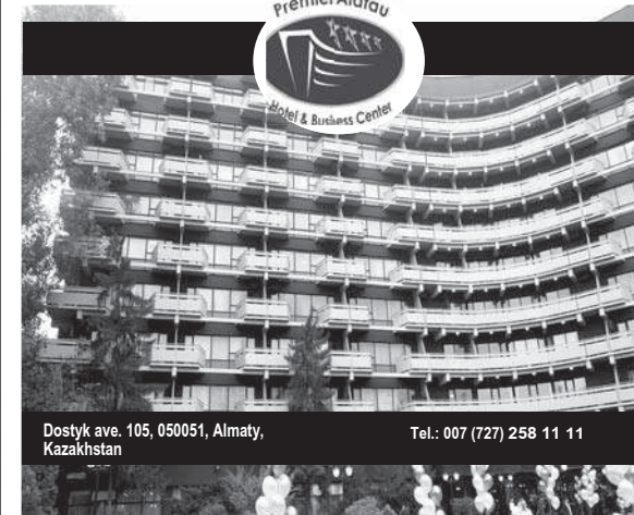
Dostyk ave. 105, 050051, Almaty, Kazakhstan