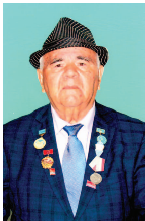
«То, что есть в человеке, бессомненно, важнее того, что есть у человека».