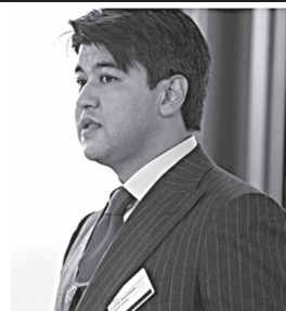
апрель-август», - отметил Куандык Бишимбаев.

Куандык Бишимбаев поделился планами Министерства экономики. По состоянию на 30 августа 2016 года к началу года индекс цен на социально значимые продовольственные товары составил 9%. Куандык Бишимбаев рассказал об основных причинах роста цен. Министр национальной экономики РК выступил с докладом на заседании правительства и поделился планами своего ведомства, сообщает корреспондент центра деловой информации Kapital.kz.